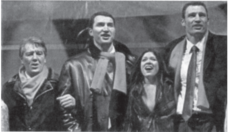
Майдан: «Ющенко «2004» СДАЛ (в прямом смысле слова) – Кличко «2012» ПРИНЯЛ»

вым ворвался на своем танке в центр Киева.