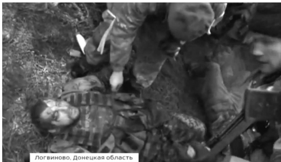
Логвиново, Донецкая область

прорваться из Дебальцево. При задержании некоторые получили ранения. Ситуация не новая. Летом потом долго обсуждали поведение офицеров, бросивших своих подчиненных в котлах. В Дебальцево заминировали железнодорожный вокзал, и не только. Готовят к сдаче и разрушают все за собой. Как немцы История повторяется.