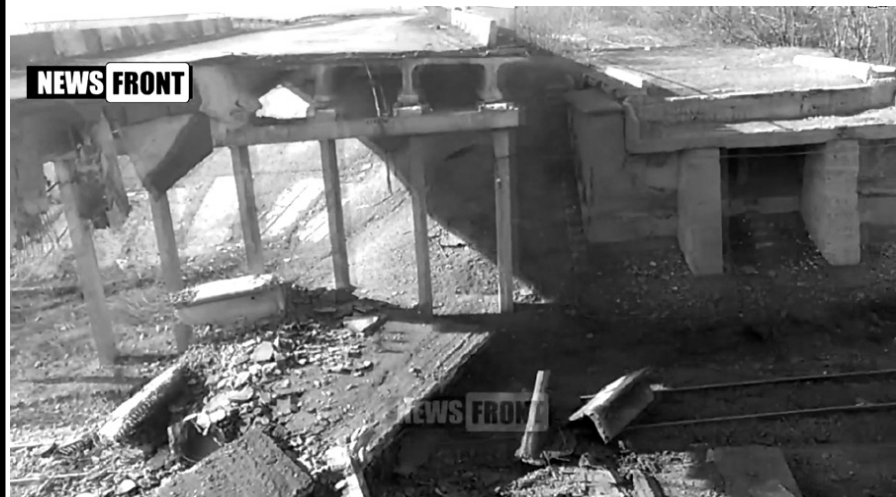
Взорванный мост в Дебальцево