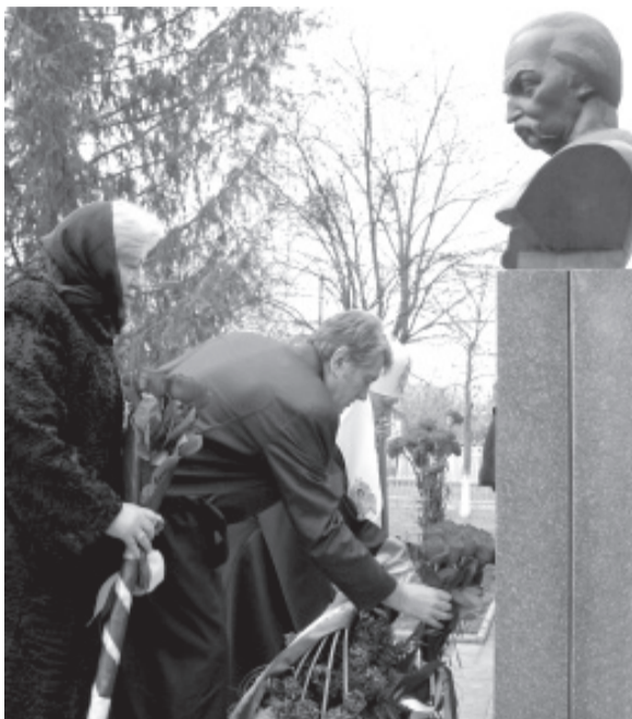
Анафемствованный Филарет и самозванный потомок Мазепы возлагают цветы своему идолу

Виктор Ющенко занялся изучением своей родословной. В результате ему удалось выяснить, что, вероятно, его предком был гетман Мазепа. При этом Ющенко уверен, что далекий предок был бы доволен политикой, проводимой сегодня украинским президентом.